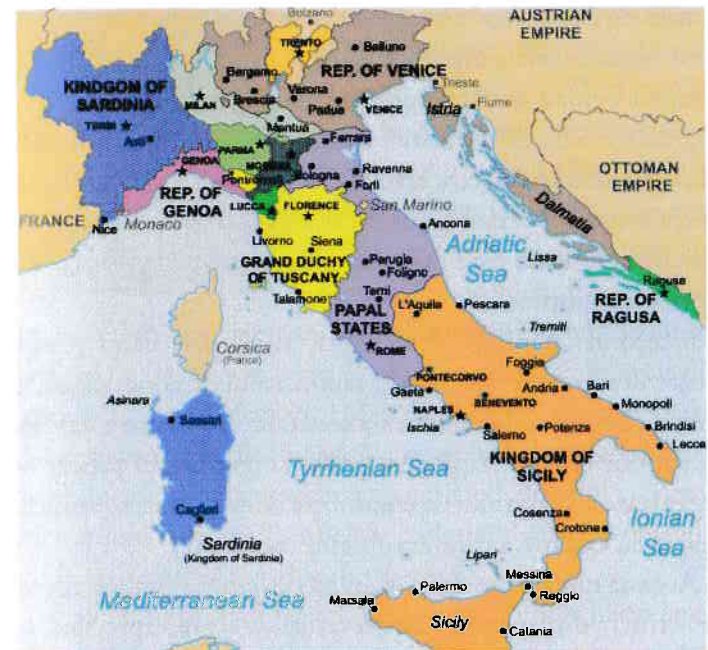
Harta Italiei renascentiste 1500

Tot în acea perioadă este elaborat primul îndrumar diplomatic, scris de diplomatul venețian Ermolao Barbaro, care avea să definească, în De officio legati , funcția ambasadorială ale cărei responsabilități principale le constituiau activitatea de informare (n.n. intrigile de la curte erau adeseori alimentate de diplomații străini) și crearea de alianțe politice.