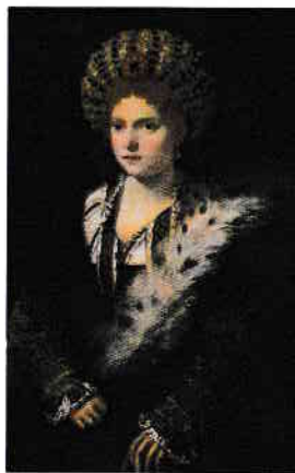
Copie foto după tabloul pictat de celebrul pictor italian Tiziano, expus la Muzeul de Istorie a Artei din Viena (Kunsthistorisches Museum)

Încercările diplomatice ale uneia dintre figurile emblematice ale Italiei renascentiste, marchiza de Mantua Isabella d'Este (1474-1539), fiica Eleonorei de Aragon, una dintre cele mai importante femei din perioada Renașterii italiene ca profil cultural și politic, au fost pe larg analizate de Alessandro Luzio 5 în primele decade ale secolului XX. Căsătoria tinerei cu marchizul Francesco II Gonzaga de Mantua